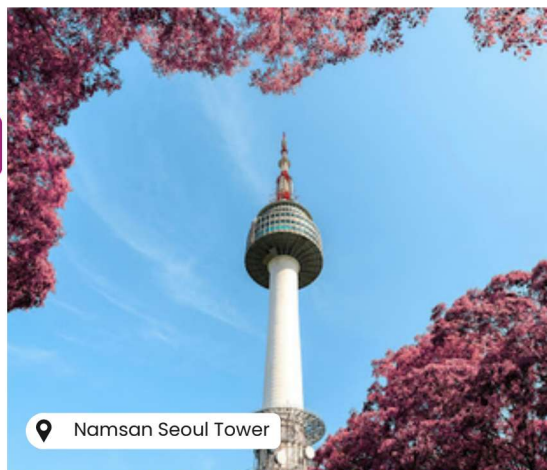
Namsan Seoul Tower

Jadual tertakluk kepada perubahan semasa