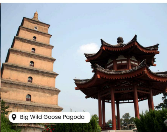
Big Wild Goose Pagoda