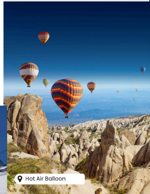
Hot Air Balloon

Scan @ Klik QR Code untuk harga & tarikh pelepasan