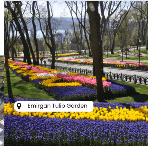
Emirgan Tulip Garden

*Sila rujuk pihak kami sebelum membuat tempahan