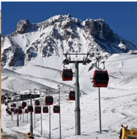
Erciyes Ski Resort