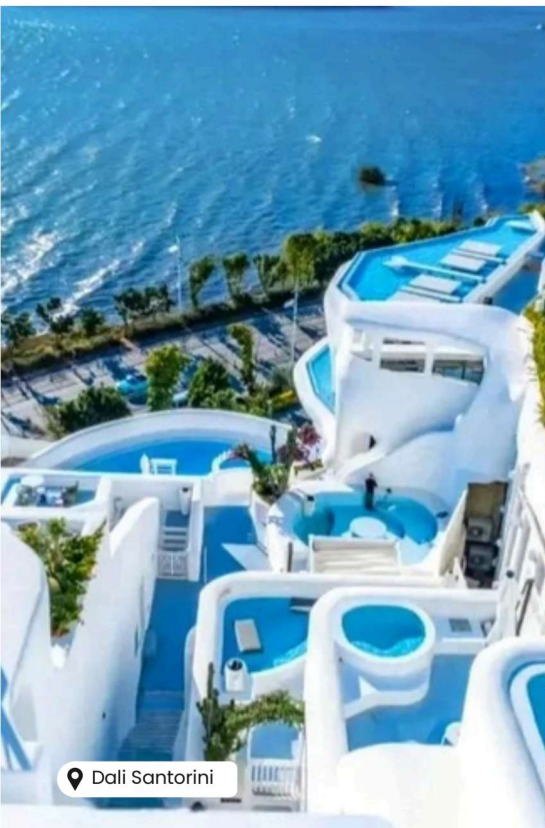
📍 Dali Santorini