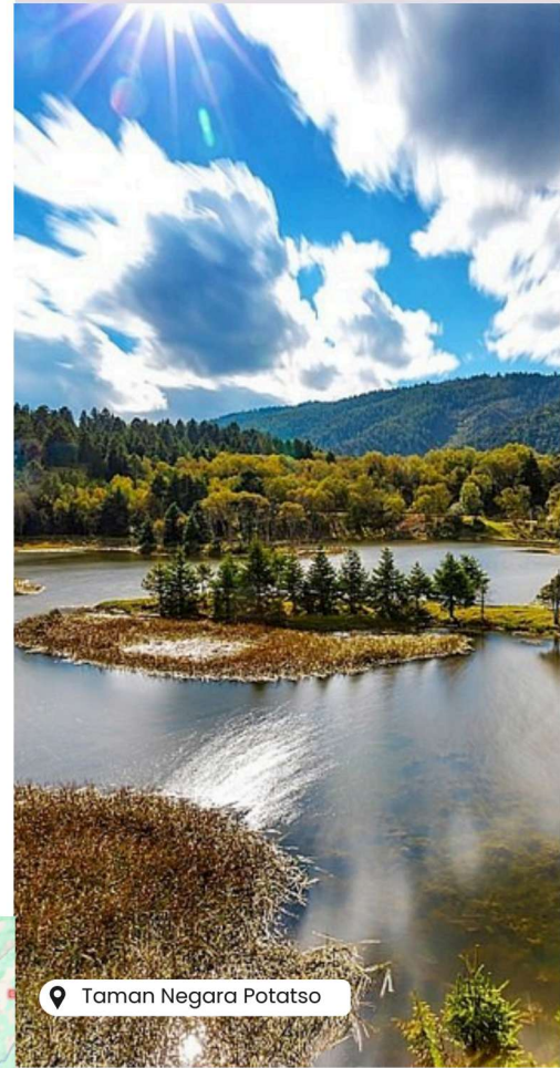
Taman Negara Potatso