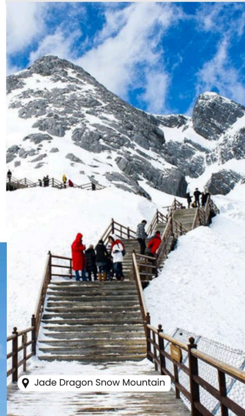
📍 Jade Dragon Snow Mountain

Scan @ Klik QR Code untuk harga & tarikh pelepasan