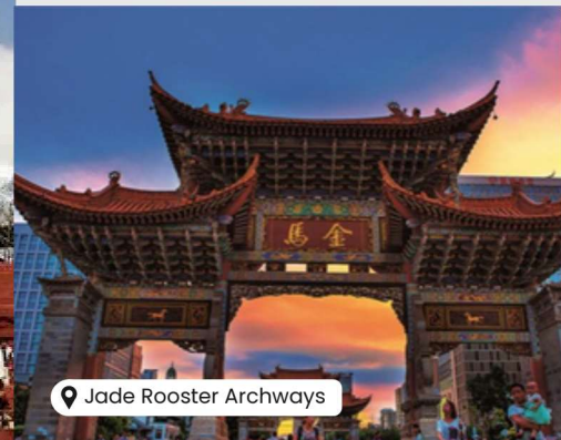
Jade Rooster Archways