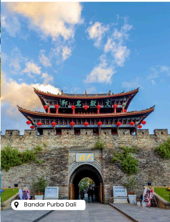
📍 Bandar Purba Dali