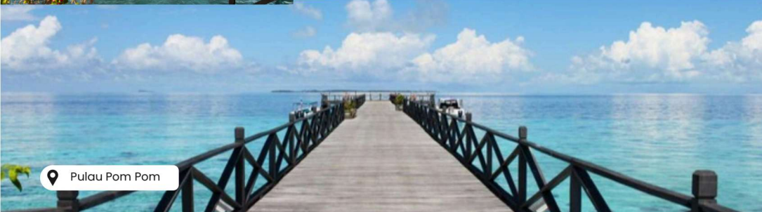
Pulau Pom Pom

Scan @ Klik QR Code untuk harga & tarikh pelepasan